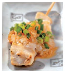
ささみおろしポン酢 180円 (税込198円)