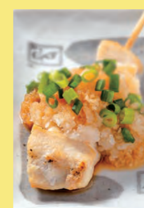
ささみおろしポン酢 180円 (税込198円)