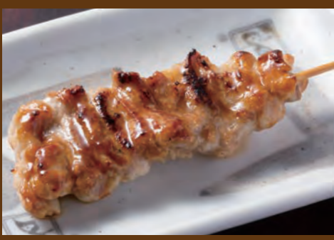
み【もも肉】 160円 (税込176円)