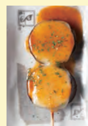
ナスチーズ 160円 (税込176円)