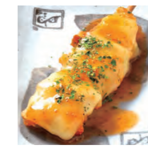
チキンチーズ 180円 (税込198円)