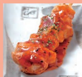
辛とまと 180円 (税込198円)