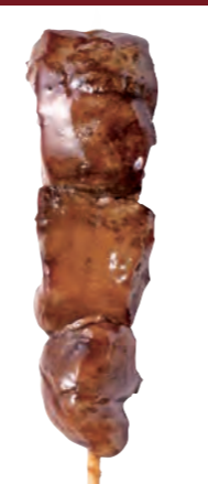
きも 【レバー】 160円 (税込176円)