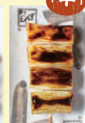
いかだ 【白ねぎ】 160円 (税込176円)