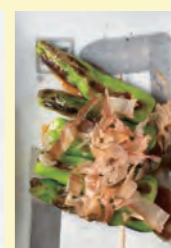
ししとう 160円 (税込176円)