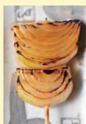
たまねぎ 140円 (税込154円)