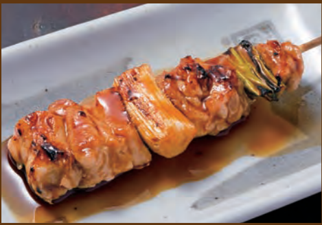
はさみ【ねぎま】 160円 (税込176円)