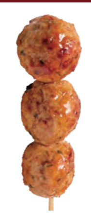
つくね 180円 (税込198円)