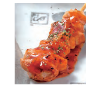
辛とまと 180円 (税込198円)