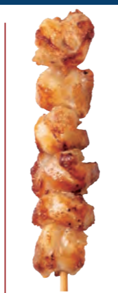
なんかつ 160円 (税込176円)