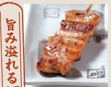
豚バラ 180円 (税込198円)