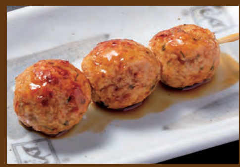
つくね 180円 (税込198円)