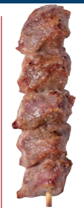
ずり 【砂肝】 160円 (税込176円)