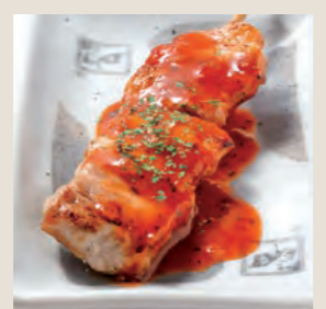
辛トン 【辛とまと豚バラ】 200円 (税込220円)