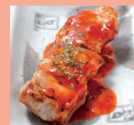
辛トン 【辛とまと豚バラ】 200円 (税込220円)