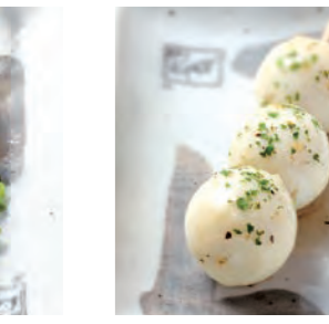
うずら玉子 140円 (税込154円)