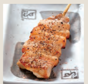
スパトン 【スパイシー豚バラ】 200円 (税込220円)