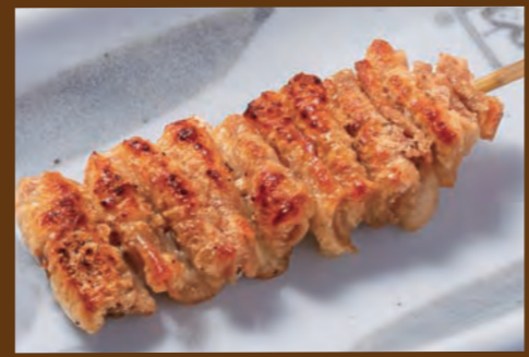
かわしおかわたれ 160円 (税込176円)