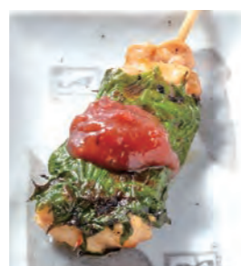
しそ巻き 180円 (税込198円)