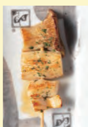
エリンギ 140円 (税込154円)