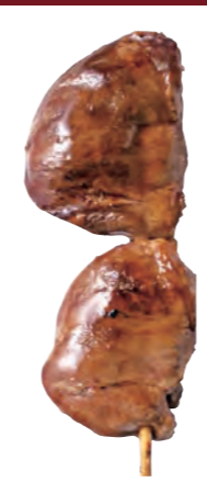
こころ 【カツ】 160円 (税込176円)