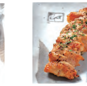
元気焼き 【ガーリック】 180円 (税込198円)