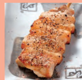
スパトン 【スパイシー豚バラ】 200円 (税込220円)