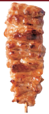
ねつく 【せせり】 160円 (税込176円)