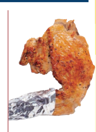
手羽先 220円 (税込242円)