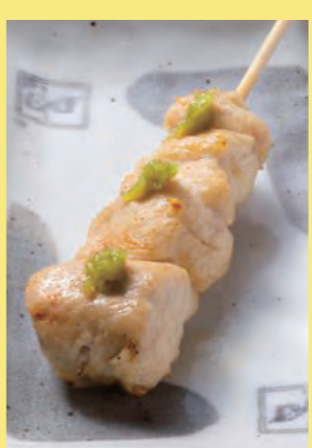
ささみわさび 160円 (税込176円)