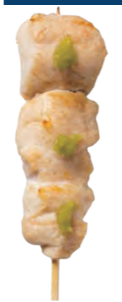
ささみわさび 160円 (税込176円)