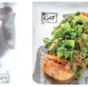
ねぎバンバン 180円 (税込198円)