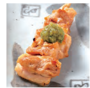
ゆず胡椒焼 180円 (税込198円)