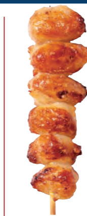
ヒップ 【三角】 160円 (税込176円)